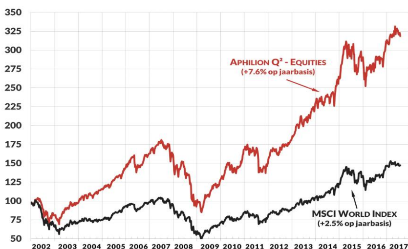
■ APHILION Q 2 - "EQUITIES" ■ MSCI World Index